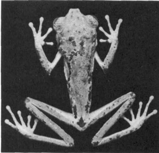
Fig. 1 – Phyllomedusa exilis sp.n., holótipo, EI Nº 5584, Santa Tereza, Estado do Espírito Santo (Comprimento rostro-anal 34,5 mm).

tarsal; dedos delgados e alongados, em ordem de crescimento 1, 2, 3, 5 e 4, com discos evidentes e calosidades subarticulares bem desenvolvidas; margens da tibia com tênue crenulado separando as faces interna e externa da ventral.